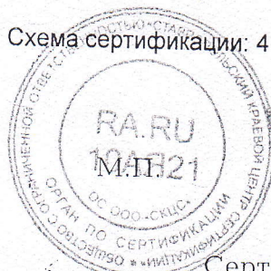
Схема сертификации: 4

акта оценки оказания услуг № 0283 от 13.04.2022г. органа по сертификации ООО "СКЦС", протоколов испытаний №12263 Д от 03.12.2021, № 12265 Д от 03.12.2021, №12266 Д от 03.12.2021, №12267 Д от 03.12.2021 АИЛЦ ФФБУЗ "Центр гигиены и эпидемиологии в Ставропольском крае в г.Кисловодске", уникальный номер записи об аккредитации в Реестре аккредитованных лиц: РОСС RU.0001.511583